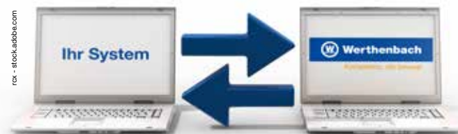
Punchout: Anbindung von Ihrem ERP an unser SAP-System

Der Prozess basiert dabei auf normierten Datenformaten, die weltweit von einem Großteil der Unternehmen verarbeitet werden können. Im Regelfall unterstützt Werthenbach den Datenaustausch im Format EDIFACT D96A, steht aber auch anderen Formaten offen gegenüber.