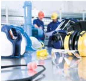
PSA + Arbeitsschutz