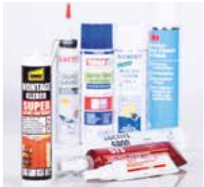
Klebstoff- und Schmierstofftechnik