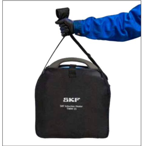
图 3 & 4—TWIM 15 携带包