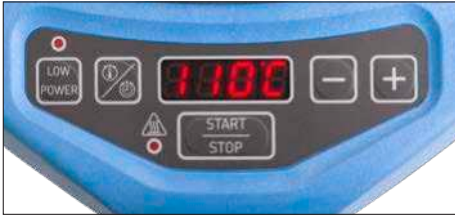
Fig. 2: Interfaz de usuario