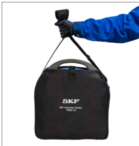
Fig. 3 og 4 – Bære- og opbevaringstaske til TWIM 15