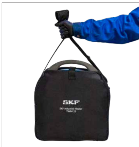
Fig. 3 e 4 – Bolsa de transporte e armazenamento do TWIM 15