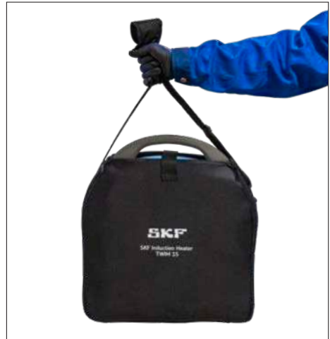
Abb. 3 und 4 – Transport- und Aufbewahrungsbeutel für TWIM 15