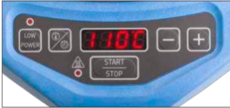
图 2 - 用户界面