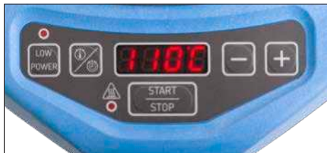
Fig. 2 – Brugergrenseflade