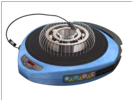
Fig. 1 – Magnetfelt omkring leje

Den bærbare induktionsvarmer TWIM 15 består af en glasfyldt polymertopplade, der modstår høje temperaturer og har elektromagnetiske spoler under sig. Når der tændes for varmeren, løber der strøm gennem spolerne, og det genererer et vekslende magnetfelt, men ingen varme på selve toppladen. Men hvis du placerer en komponent af jern eller rustfrit stål ovenpå, inducerer magnetfeltet mange mindre elektriske strømme (hvirvelstrømme) i komponenternes metal.