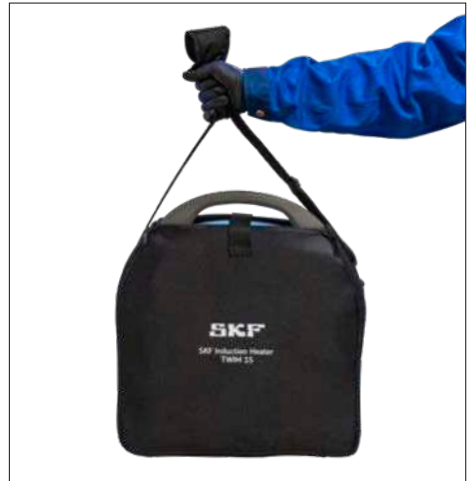
Fig. 3 & 4 – Sacoche de transport et de rangement du TWIM 15