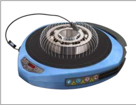
Fig. 1 – Campo magnético ao redor do rolamento

O aquecedor por indução portátil TWIM 15 consiste em uma placa de polímero reforçado com fibra de vidro, resistente a altas temperaturas, e bobinas eletromagnéticas, situadas abaixo da placa. Quando o aquecedor está ligado, uma corrente elétrica passa pelas bobinas e gera um campo magnético oscilante, que não aquece a placa superior em si. Porém, assim que um componente de ferro ou aço inoxidável é colocado sobre a placa, o campo magnético induz muitas correntes elétricas pequenas (correntes parasitas) no metal dos componentes.