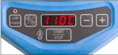
Fig. 2 – Interface de usuário